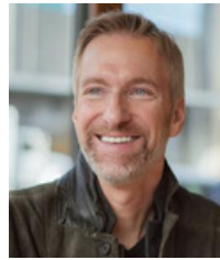
MAYOR | ALCALDE | МЭР TED WHEELER

More information at Mas información en Более подробная информация на portlandoregon.gov