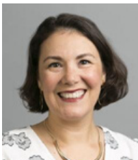
COMMISSIONER | COMISIONADA ОКРУЖНОЙ КОМИССАР

JESSICA VEGA PEDERSON DISTRICT 3 | DISTRITO 3 | ОКРУГ 3 501 SE Hawthorne Blvd, Suite 600 Portland, OR 97214 503-988-5217 | multco.us/commissioner-vega-pederson district3@multco.us